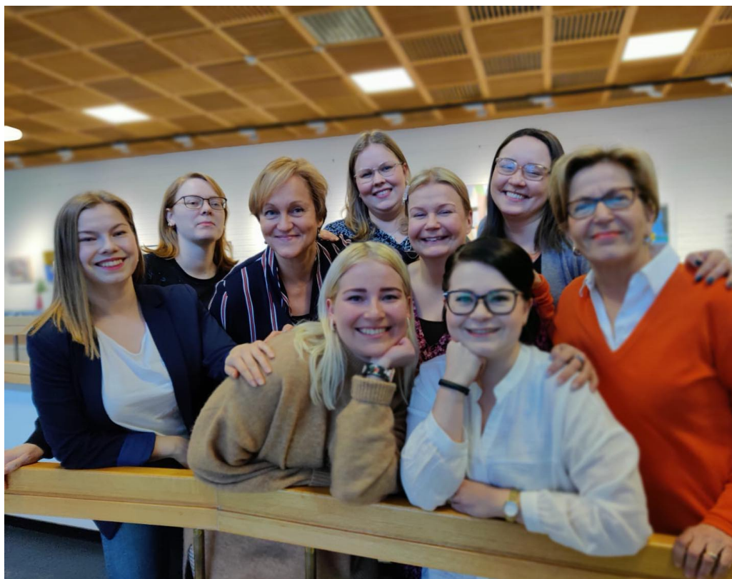
Kuva: Hallitus Gustavelundissa

Hallitus piti vuonna 2020 yhteensä 16 kokousta, joista viisi oli sähköpostikokousta ja yksi kaksipäiväinen seminaari Hotelli Gustavelundissa, Tuusulassa. Työvaliokunta piti yhteensä 11 kokousta vuoden 2020 aikana.