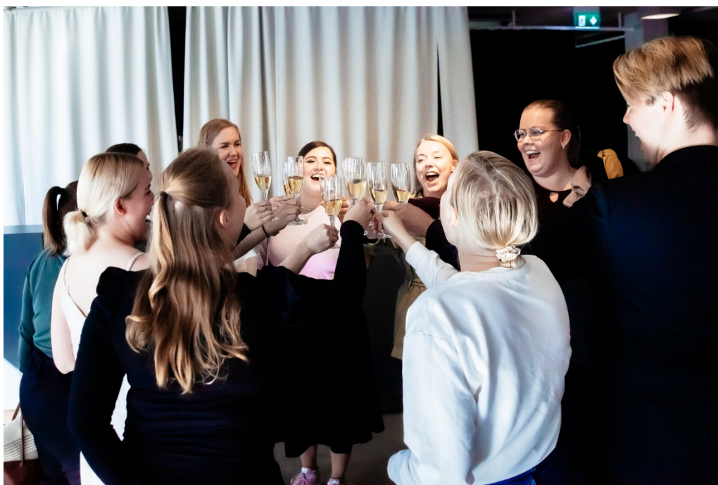
Kuva: Syyskokouksen maljat uudelle nimelle

Yhdistys on jo aiemmin todennut, ettei opiskelijoihin painottuva jäsenhankinta ole jatkossa kestävä tapa rekrytoida uusia jäseniä, vaan jäsenhankintaa tulee kehittää sääntömuutoksen seurauksena enemmän työssäkäyvien jäsenten suuntaan. Kehittäminen ei koronan, henkilöstömuutosten ja nimenmuutosprosessin vuoksi onnistunut vielä vuonna 2020, mutta siihen panostetaan vuonna 2021. Positiivinen jäsenmäärän kehitys kasvattaa jäsenmaksutuloja, mikä takaa monipuoliset palvelut yhdistyksen jäsenille.