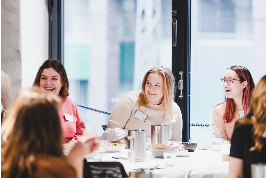
Kuva: Opiskelijoiden syksyn kokokohta, Urailta 15.10.2020.

ja toinen valmistuneiden ilta, sekä uutena tapahtumana kaksi maalauskurssia. Opiskelijaverkoston toiminta oli aktiivista koko vuoden ja verkostoon saatiin myös uusia jäseniä vuoden aikana.